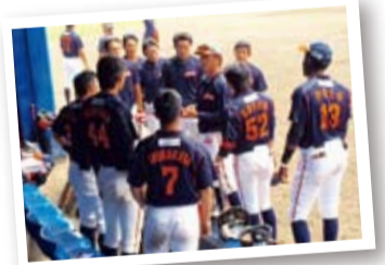
▲7月3日(金)伯和ビクトリーズとの交流戦より

※7月も、他の3球団とのオープン戦他予定しています。詳しくは、公式HPで随時発表していきます。