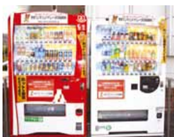
▲舞扇(伊予郡砥部町)の店頭で設置されている「MP自販機」

愛媛マンダリンパイレーツは、四国アイランドリーグplusオフィシャルスポンサーの「四国コカ・コーラボトリング(株)」の協力を得て、「愛媛マンダリンパイレーツ応援自動販売機」の設置活動を進めています。応援自動販売機の収益の一部がマンダリンパイレーツの活動資金となります。ぜひご協力をお願いいたします。