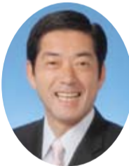
愛媛県知事 中村 時広氏

待ちに待った「四国アイランドリーグPlus」2012シーズンの開幕を、心からお喜び申し上げます。 愛媛マンダリンパイレーツは、地域密着型のプロスポーツ球団として本県スポーツの振興はもとより、地域の活性化に貢献させていただき、厚くお礼申し上げます。 県民球団となつて3年目を迎えた今年、県民の期待はますます高まっております。リーグ発足8年目となる今シーズンは、ぜひとも悲願の総合優勝を果たされ、県民に「あふれる笑顔(えがお)」をもたらしていただくとともに、県民に親しまれ愛される「愛顔あふれる県民球団」として、一層の成長を遂げられますことを願っております。 終わりに、愛媛マンダリンパイレーツの皆さまの御発展と、選手の皆様のご活躍を祈念申し上げます。